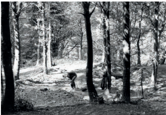
↑ Opgravingen op de Kemmelberg in de jaren '60